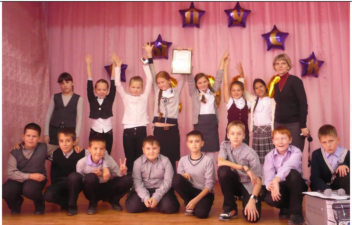
Посвящение в пятиклассники