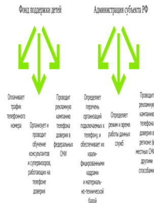
Распределение полномочий по организации работы телефона доверия

Действия телефонного консультанта, если ему поступает сигнал о том, что ребенок подвергается насилию: